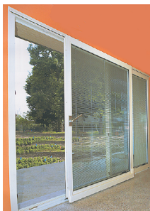
portafinestra scorrevole parallelo

Partner NIKITA Distributore serramenti PVC per ogni tipologia