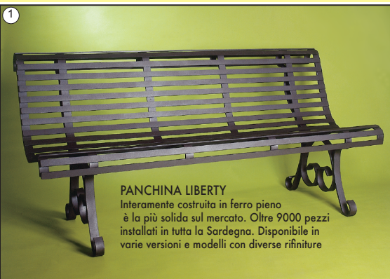
PANCHINA LIBERTY Interamente costruita in ferro pieno è la più solida sul mercato. Oltre 9000 pezzi installati in tutta la Sardegna. Disponibile in varie versioni e modelli con diverse rifiniture