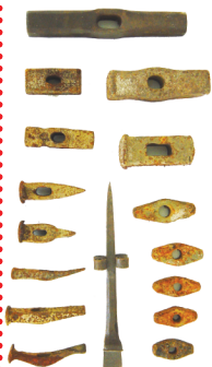
Collezione OMG, martelli.