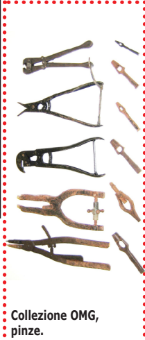
Collezione OMG, pinze.

1, 2, 3 - Ringhiera in acciaio inox - Lido di Orri Tortoli 4 - Parete divisoria in acciaio PALLADIO e cristallo centro medico Cagliari 5 - Scala acciaio e vetro blindato - centro medico Cagliari