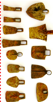
Collezione OMG, zappe.