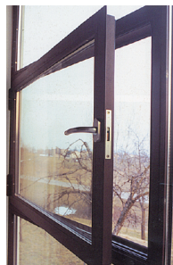
Finestra acciaio blindato verniciato epossidico

Partner PALLADIO Acciaio palladio zincato e inox siamo trasformatori dell'acciaio in tutte le tipologie