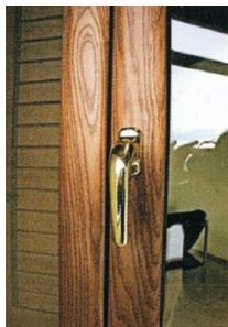
Finestra in alluminio e legno

Partner GMA Distributore finestre e persiane in alluminio e legno alluminio